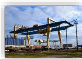
ПК «Дніпро-Ліски» Загальна площа складів – 32 557 м 2