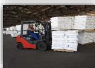
ПК «Одеса-Ліски» Загальна площа складів - 13 140 м 2