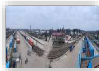
ПК «Скнилів-Ліски» Загальна площа складів – 5500 м 2 ПК «Вадул-Сірет» Загальна площа складів – 2 000 м 2 ПК «Тернопіль» Загальна площа складів – 5 000 м 2