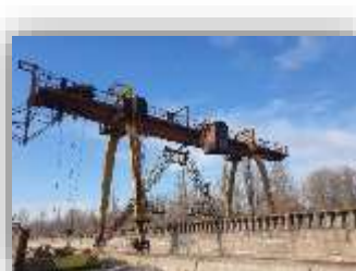
ПК «Харків-Ліски» Загальна площа складів – 18 447 м 2 ПК «Кременчук-Ліски» Загальна площа складів – 25 650 м 2