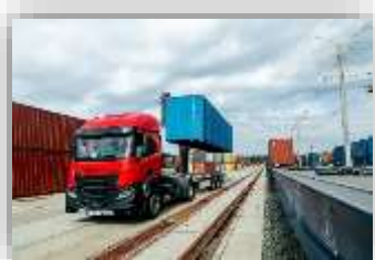
ПК «Київ-Ліски» Загальна площа складів – 12 866 м 2