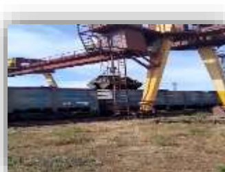
ПК «Чоп-Ліски» Загальна площа складів – 11 294 м 2